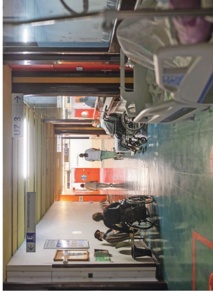
Zavarovanci z zadržanimi pravicami na račun obveznega zavarovanja lahko uveljavljajo le pravico do nujne medicinske pomoči in nujnega zdravljenja.

Med osebam, ki so jim zadržane pravice iz OZZ, se znajdejo tudi tiste, ki se jim to ni smelo zgoditi. Po sodbi ljubljanskega delovnega in socialnega sodišča, ki se ni pravdomočno, so bile namreč pravice neuveljavljeno zadržane tudi možu, ki je v zavarovanje vključen kot zakonec – prek zaposlene žene. Pravice so mu letos zadržali, ker je imel dolg iz neplačanih prispevkov izpred več let in iz svojega preteklega zavarovanja